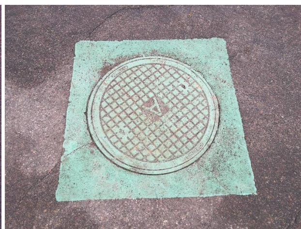
Figur 2. Dagvattenbrunn.